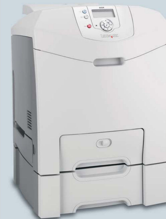
所示机型为带有可选 500 页进纸盘的 C524n/dn

您可以按需打印 HR 和销售表单、手册、当前股票价格以及您的在线清单，这里不再一一列举了。