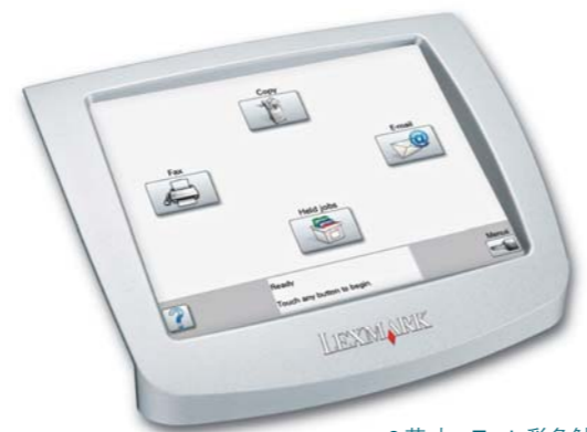
8 英寸 e-Task 彩色触摸屏

X646e 采用了利盟独有的 e-Task 彩色触摸屏，使用十分简便，即使是初次使用者也能快速掌握。