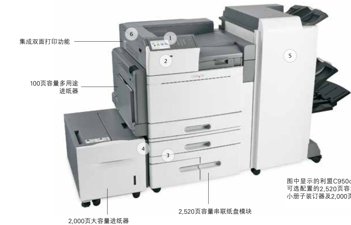
图中显示的利盟C950de彩色打印机带有可选配置的2,520页容量串联纸盒模块、小册子装订器及2,000页大容量进纸器。